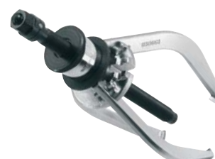
Estrattore con griffe interno/esterno