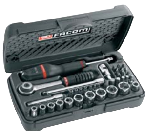
Cassetta "Radio" - 1/4" 37 utensili