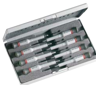
Assortimento di 8 giraviti Microtech®