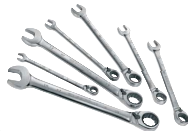
Serie di 7 chiavi a cricchetto