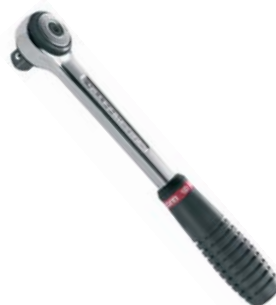
Cricchetti (1/2" - 3/8" - 1/4")