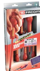
Serie di 6 giraviti 1000 Volts