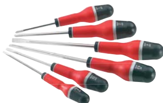
Serie di 6 cacciaviti professionali