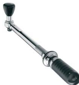
Chiavi dinamometriche a riarmo automatico "alta precisione"