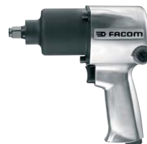
Avvitatore pneumatico potente 1/2"