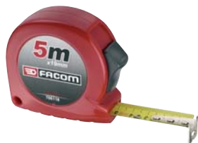
Flessometri ad altissime prestazioni