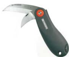
Coltello multiuso 2 lame con astuccio