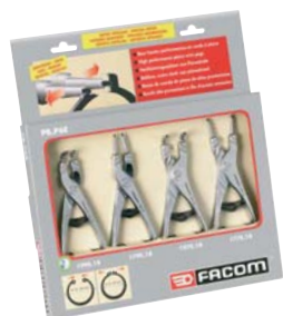
Serie 4 pinze ad alta resistenza per anelli elastici