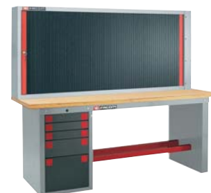
Banchi da lavoro attrezzati