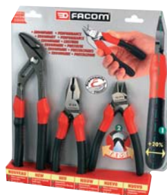
Assortimento di 3 pinze