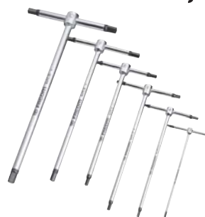
Serie di 6 chiavi maschio a T