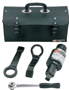
Moltiplicatore di coppia con assortimento