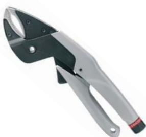
Pinza a scatto con impugnatura in alluminio