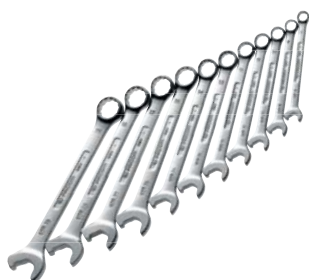
Serie di 11 chiavi ad effetto cricchetto