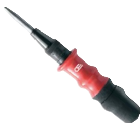
Bulino automatico con guaina