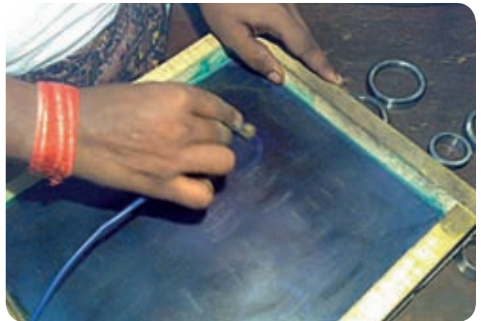
Marchi falsi vengono incisi sui cuscinetti utilizzando strumenti per la serigrafia come questo.