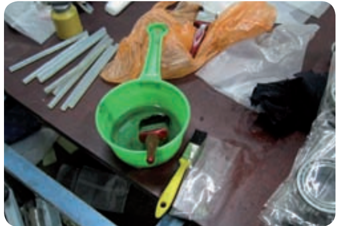
Strumenti tipici utilizzati per le contraffazioni.

Invece di un prodotto di qualità eccellente, i clienti finiscono per acquistare prodotti di scarsa qualità ad un prezzo molto superiore al loro valore reale.