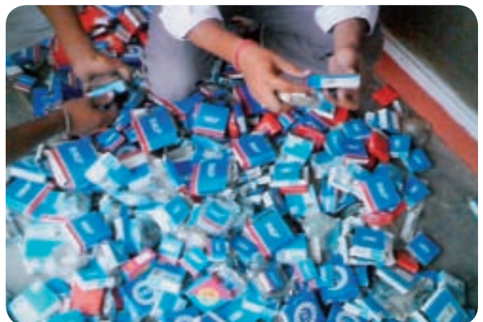
Cuscinetti contraffatti confiscati durante una retata della polizia.