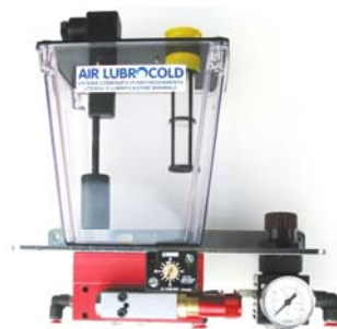
Centralina con serbatoio un litro, una mini pompa