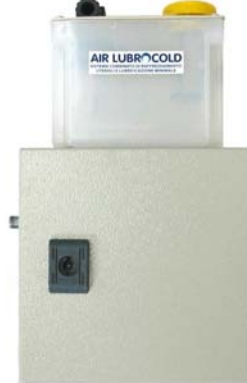
Centralina in scatola metallica con serbatoio 1,2 litri, una mini pompa