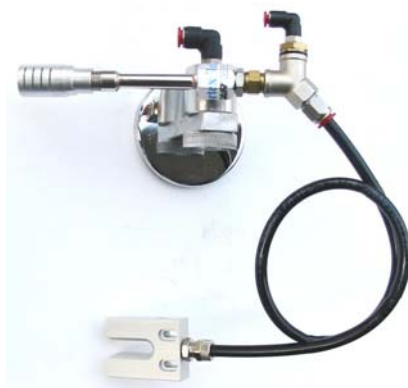
Ugello aria fredda-olio versione a forcella per segatrici - troncatrici