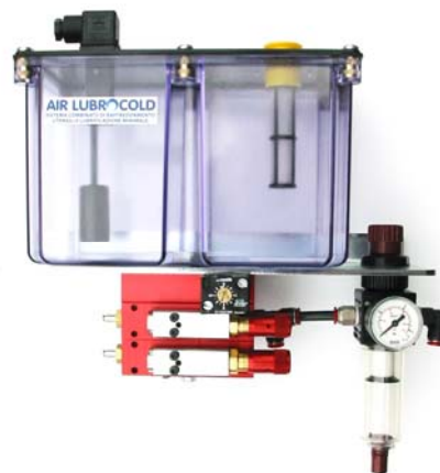
Centralina con serbatoio tre litri, due mini pompe