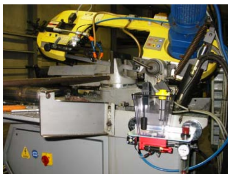
AIR LUBROCOLD a due uscite installato su segatrice