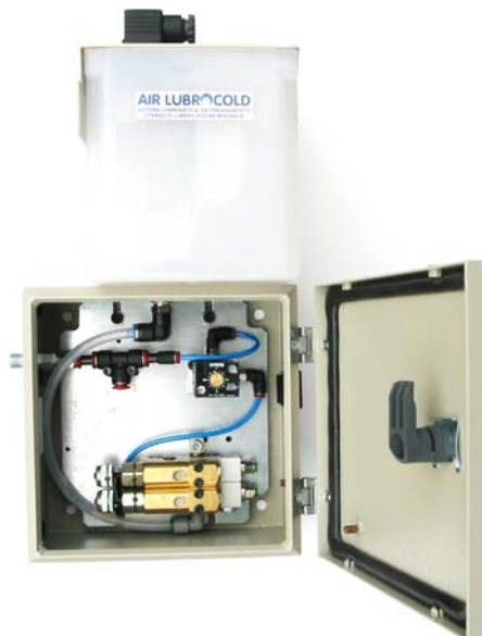
Centralina in scatola metallica con serbatoio 2,2 litri, due mini pompe