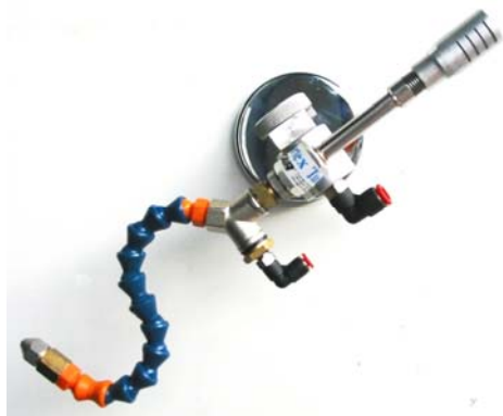
Singolo ugello aria fredda-olio con base magnetica