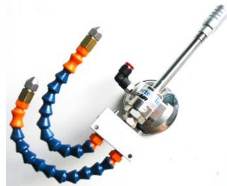
Doppio ugello aria fredda-olio con base magnetica